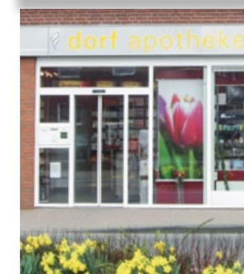
Dorf Apotheke, Kapellen Dorf Apotheke Cuypers, Walbeck